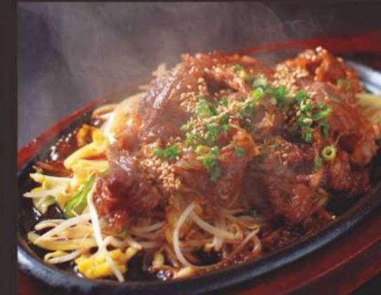
黒毛和牛焼肉定食(薄切り) 1,180円 ごはん、汁物、サラダ、おつけもの付