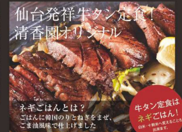
仙台発祥牛タン定食! 清香園オリジナル ネギごはんとは? ごはんを韓国のりとねぎをまぜ、 ごま油風味で仕上げました 牛タン定食は ネギごはん! 白米・牛タンが楽しめることも あります。 新牛タン定食 1,520円 ネギごはん、汁物、サラダ、おつけもの付