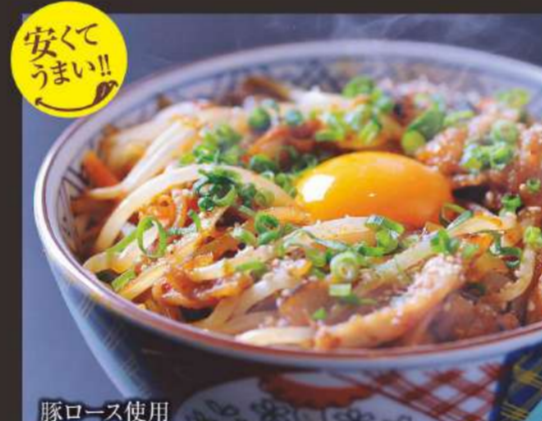
安くてもうまい!! 清香園のぶた丼 930円 サラダ、汁物、キムチ付