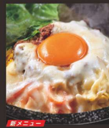
新メニュー チーズ石焼ビビンバ定食 1,180円 サラダ、汁物、キムチ付