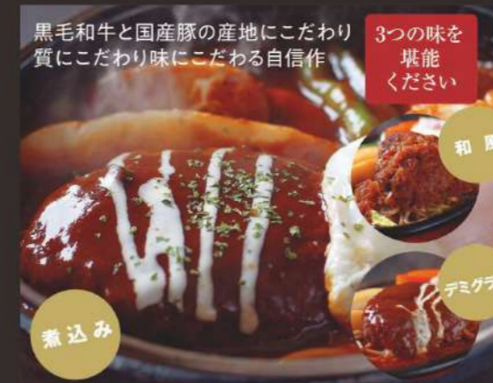
こだわりのハンバーグ 各 1,290円 ごはん、汁物、サラダ、おつけもの付

●表示されている金額は全て税込です。●盛付けが写真と異なる場合がございます。 ●内臓系商品の一部は国産肉ではありません。