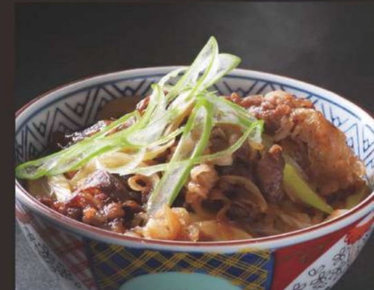
黒毛和牛牛丼 単品 980円 +110円 おつけもの・みそ汁付 +60円で生たまご付