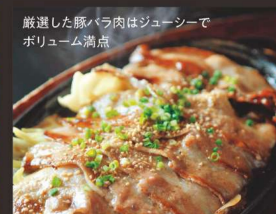
厳選した豚バラ肉はジューシーで ボリューム満点 塩バラ定食 980円 ごはん、汁物、サラダ、おつけもの付