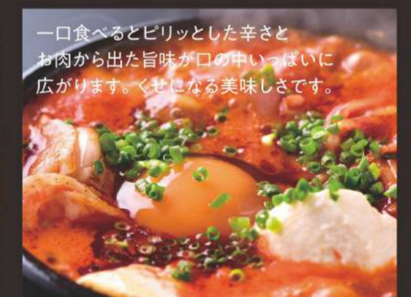
一口食べるとピリッとした辛さと お肉から出た旨味が口の中いっぱい 広がります。くせになる美味しさです。 豆腐チゲ定食 1,140円 ナムル、ごはん、サラダ、おつけもの付