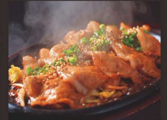
生姜焼き定食 980円 ごはん、汁物、サラダ、おつけもの付