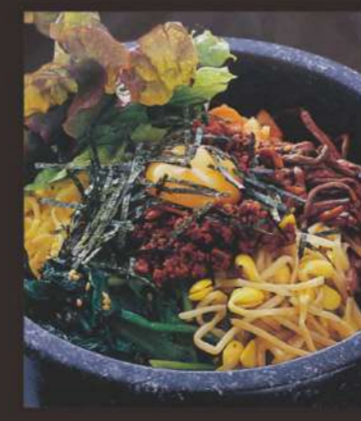
石焼ビビンバ定食 1,080円 サラダ、汁物、キムチ付