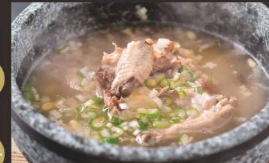
厳選食材をコクのある スープで仕上げた自慢の一品 サムゲタン 1,200円 サラダ、おつけもの付