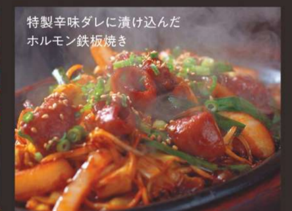
特製辛味ダレに漬け込んだ ホルモン鉄板焼き ぶうふう焼定食 980円 ごはん、汁物、サラダ、おつけもの付